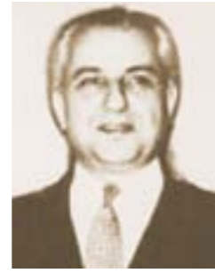
Sadık GİZ (1952 – 1953)