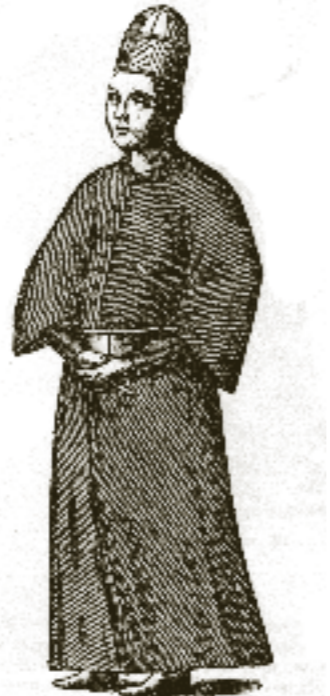
17. Yüzyılda, Galata Sarayı Mektebi'nin Öğrenci Kıyafeti

Ayrıca, bir de "Kasr-ı Hümayun" denen Hünkar Köşkü yapılmıştı. Bu köşk, Padişahların Mektebiziyaretlerinde misafir edildikleri özel bir yerdi. Sonraları bu binalara, I.Mahmut zamanında inşa ettirilen Saray Ağası Dairesi, bir büyük kütüphane