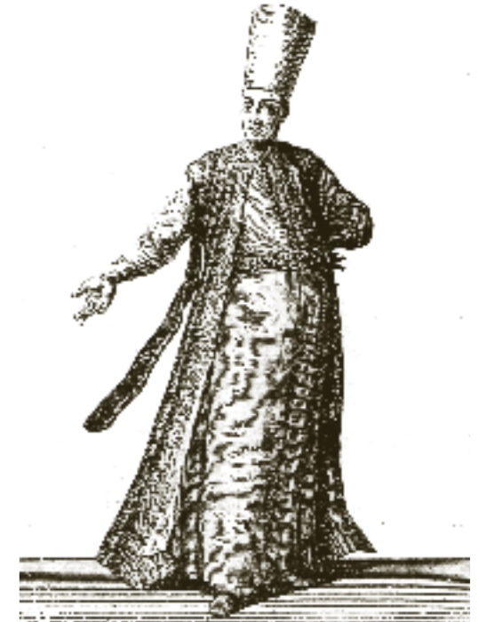
18. Yüzyılda, Galata Sarayı Mektebi'nin Ağasının Kıyafeti

(Fethi İsfendiyaroğlu, Galatasaray Tarihi, Doğan Kardeş Yayınları, 1954)