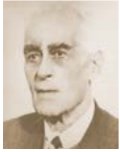
Ethem MENEMENCİOĞLU (1937 – 1939)